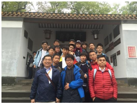
全體團員於嶽麓書院門前的合影，這應該是每一次出訪湖南師大附中都會有的代表性畫面了