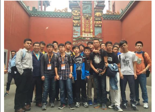
全體團員於長沙著名飲食重鎮—火宮殿享用完午餐後的合影