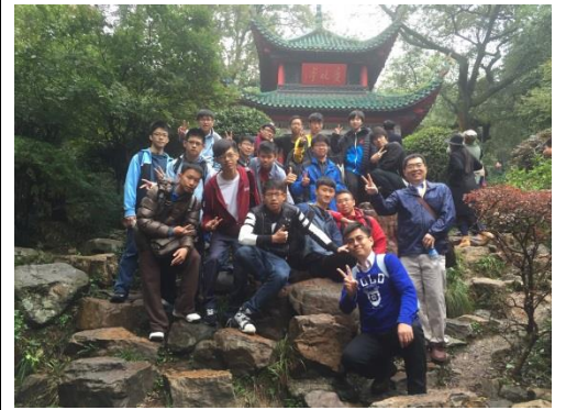
全體團員在愛晚亭的合影，歡愉的表情顯示大家雖然行程已進入倒數第二天，依舊充滿期待