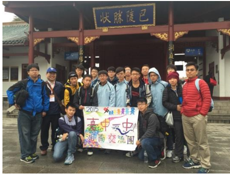
參觀洞庭湖與岳陽樓，雖遇天候不佳，但同學們仍對於當天乘坐中國高鐵的科技成就，以及岳陽樓的古色古香印象深刻